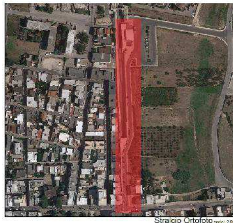
Straicio Ortofoto scala: 1:600